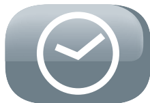
Timer (8 ore)