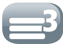
Filtro a 3 strati