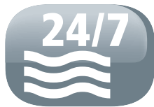
Scarico continuo dell'acqua